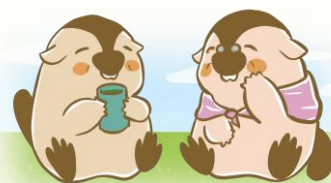
マスコットキャラクター